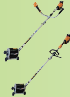
ダブル 削り幅 120mm

希望小売価格 2.0Ah バッテリー仕様 両手ハンドル BBH800HBDU-201 ループハンドル BBH800HBDL-201 ¥89,100 (税込) 4.0Ah バッテリー仕様 両手ハンドル BBH800HBDU-401 ループハンドル BBH800HBDL-401 ¥101,200 (税込)