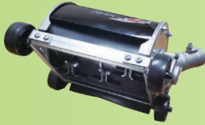
トリプルタイプ (AUT-TK17) 削り幅 170mm

希望小売価格 ¥30,800 (税込) 本体質量 2.2 kg / 寸法 D190×L230×H130mm 推奨エンジン 20cc 以上