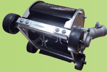
ダブルタイプ (AUT-TK12) 削り幅 120mm

希望小売価格 ¥30,800 (税込) 本体質量 2.2 kg / 寸法 D190×L230×H130mm 推奨エンジン 20cc 以上